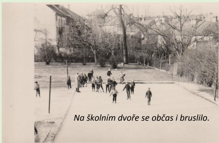
Na školním dvoře se občas i bruslilo.