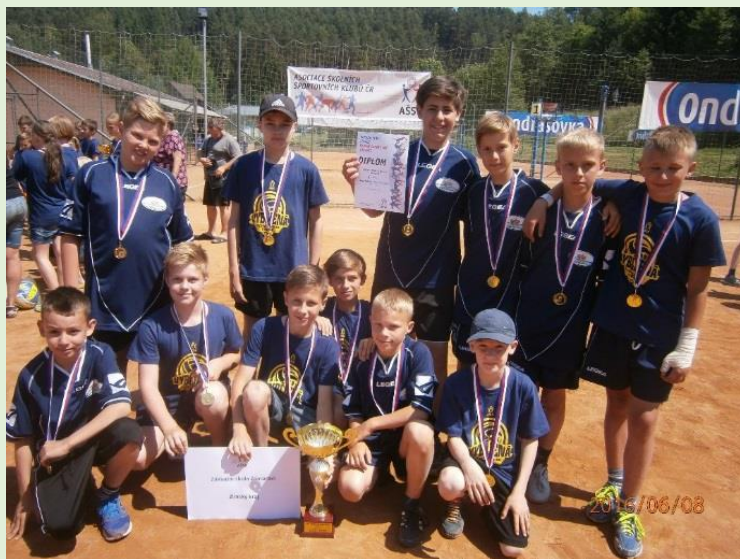
Jsmo mistři České republiky ve vybíjené

Z nich je nejznámější turnaj ve vybíjené "O hanácké koláč", pořádaný naší školou pro celý region.