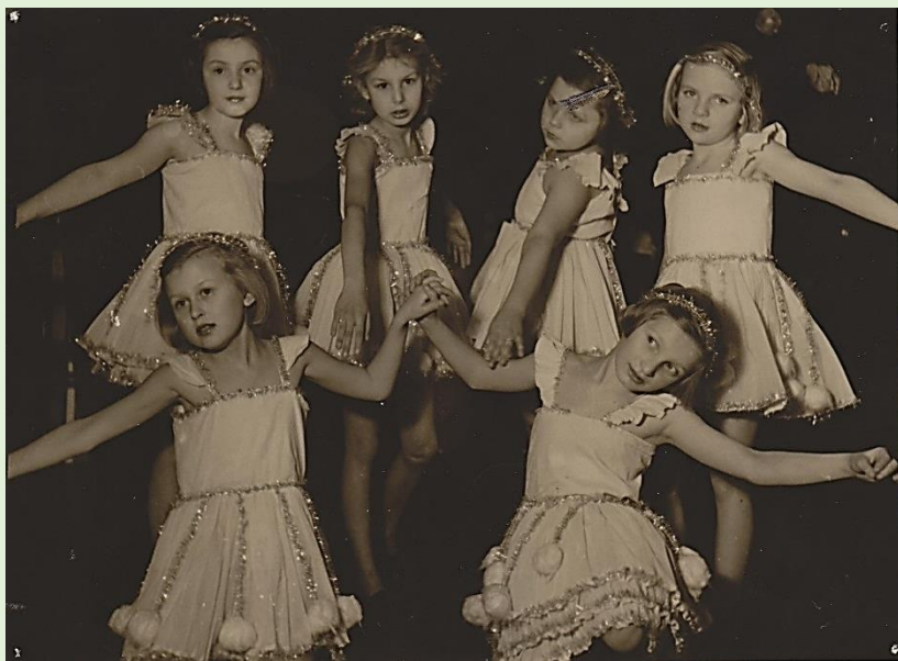
Tyhle tanečnice byly ve třetím ročníku ve školním roce 1956 - 1957

Národní shromáždění přijalo v dubnu 1953 „Zákon o školské soustavě a vzdělávání učitelů“, kterým byla i škola na Švabinského nábřeží